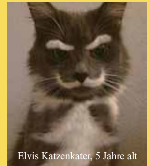
Elvis Katzenkater, 5 Jahre alt